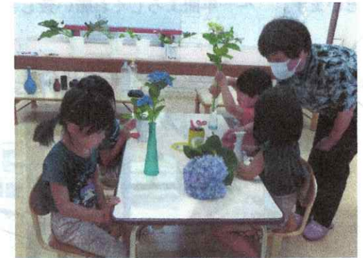
～美育活動(一輪挿しをしてみよう!)～