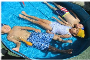
今年の夏もケガや事故なくプール遊びを楽しむことができました。持ち物の準備など、ありがとうございました。