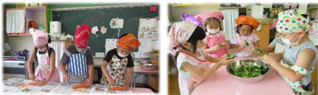
8/2(水)3、4、5歳児でカレーのクッキングをしました。保育園で育てた野菜も一緒にクッキングし、特別なカレーが完成☆『おいしい〜♪♪』と、大喜びでした☆この日は、年長さんがお米とぎをしてくれ、ほかほかのご飯もいただきました!

☆…☆…おしらせ…☆…☆ 9月よりプールカードから検温チェックカードに切り替わります。引き続き、毎朝の検温をお願いします。 朝夕、日中と寒暖の差が激しい時期です。衣服の調節しやすいよう半袖、長袖の着替えを持たせてください。(名前の記名も忘れずをお願いします。) おむすびの日