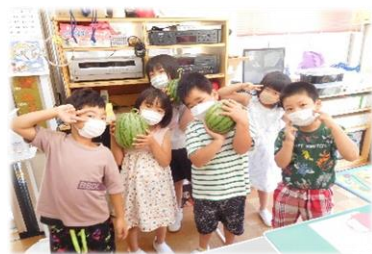
今年も地域の方よりスイカを頂きました。給食でおいしくいただきました。ありがとうございました!