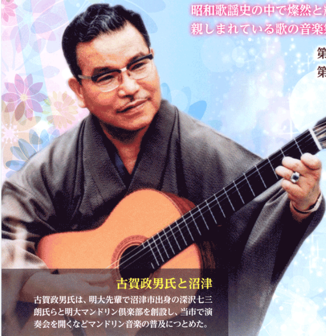
古賀政男氏と沼津

古賀政男氏は、明大先輩で沼津市出身の深沢七三朗氏らと明大マンドリン倶楽部を創設し、当市で演奏会を開くなどマンドリン音楽の普及につとめた。