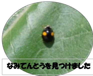
なみてんとうを見つけました