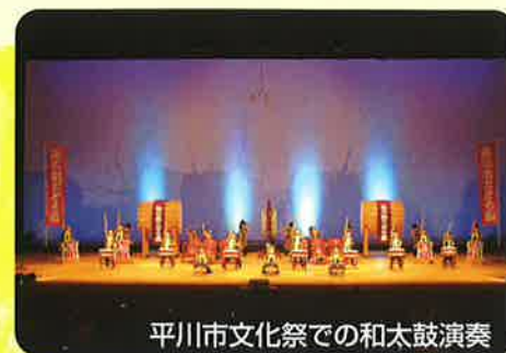
平川市文化祭での和太鼓演奏