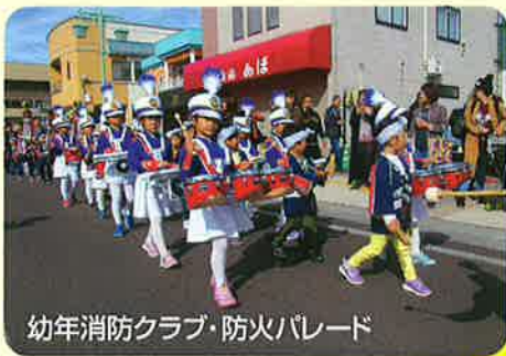
幼年消防クラブ・防火パレード