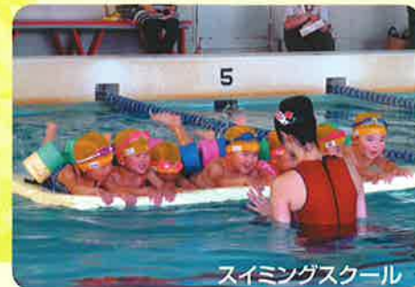
スイミングスクール