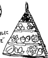
切ったダンボールに 木の実をボンドで 付ける