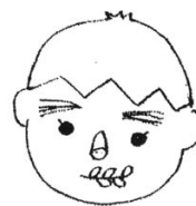
松葉や木の実で 「ふくわらい」