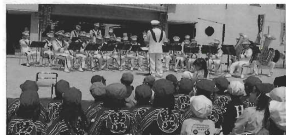
熱心に音楽隊の演奏を聞く子どもたち

ら約150名余りが参加、童謡やアニメ主題歌など楽しみながら防災についての面白い話に耳を傾けました。子どもたちは避難時の合言葉「おはしも」を覚えていただき、「押さない」「走らない」「しゃべらない」「もどらない」をしっかり覚えたようです。保護者や老人会の方々にも、普段の訓練が特に大切であることをわかっていただけようです。