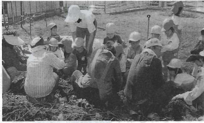
みんなで芋ほり開始

学生のボランティアが日常的に来園、園児たちとの交流を深めてくれています。シニアボランティアの方たちも10数名、園内の菜園で園児と一緒に四季折々の野菜の種蒔きから収穫、そして楽しいクッキング・食事に会関わってもらっています。