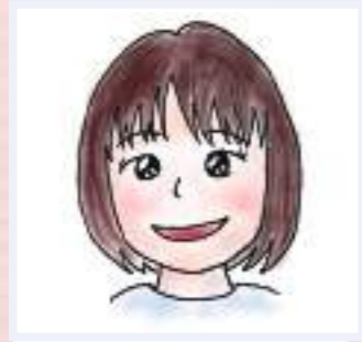
2023年公津の杜保育園入職

1歳児の担任をしています。毎日、子どもの姿や成長を見ることができ、とても楽しくやりがいを感じています。また、面白かったことやエピソード、困ったことなども職員同士で共有し合い、一緒に考えたり、笑いあったりできるステキな職場です。元気いっぱいな子どもたちに囲まれながら、一緒に働いてみませんか。