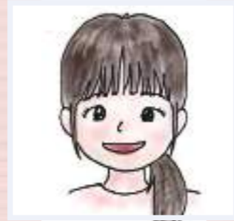
2021年宗吾保育園入職

1歳児の担任をしています。毎日、子どもの姿や成長を見ることができ、とても楽しくやりがいを感じています。また、面白かったことやエピソード、困ったことなども職員同士で共有し合い、一緒に考えたり、笑いあったりできるステキな職場です。元気いっぱいな子どもたちに囲まれながら、一緒に働いてみませんか。