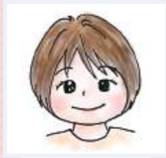
2010年宗吾保育園入職

異年齢児(3歳児クラス)の担任をしています。年上児が保育士と一緒に年下児を助けてくれたり、年下児が大好きなお兄さんお姉さんのまねっこをしたりする姿にあたたかさを感じながら日々楽しく保育しています。悩んだり、大変に感じることもありますが、子どもからの言葉にパワーをもらいながら、自分自身も子どもたちと一緒に成長できる仕事です。